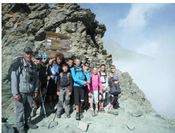
Les élèves de la section sportive du collège de Guillestre au Col de la Traversette

Dans le cadre d'un partenariat avec la section sportive du collège de Guillestre, une dynamique a permis le lancement d'un projet d'éducation et de sensibilisation à la découverte de la flore et la faune du Haut-Guil . Ainsi des élèves de troisième ont participé au dénombrement de la Perdrix bartavelle à Abriès et des élèves de cinquième ont découvert la montagne pendant deux jours avec nuitée au refuge du Viso en partenariat avec le Club Alpin Français.