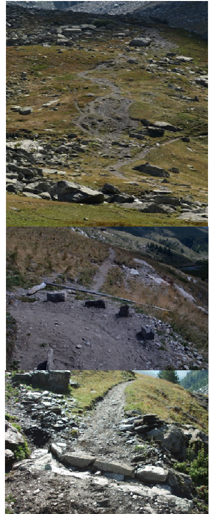
Réhabilitation des sentiers dégradés au Belvédère du Viso

L'année 2013 a été aussi le moment d'entreprendre des actions concrètes et des travaux . Ainsi afin de mettre un terme aux dégradations causées par la fréquentation pédestre, l'effort s'est porté sur la gestion et l'aménagement des sentiers pédestres :