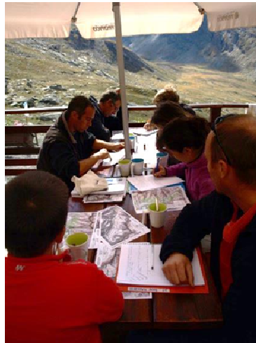
Rencontre au Refuge du Viso avec les partenaires de la gestion des alpages

Les travaux initiés en 2013 avec le CERPAM (Centre d'Etudes et de Réalisations Pastorales Alpes Méditerranée) permettent de refaire le point sur l'exploitation de l'alpage du Viso et sur l'alpage de la Roche écroulée. Techniciens pastoraux, agents de la réserve naturelle et du PNR du Queyras, Association pastorale de Ristolas et chasseurs travaillent ensemble pour préciser les modalités d'utilisation des alpages et définir les besoins et les actions nécessaires pour améliorer la relation entre patrimoine naturel et pâturage.